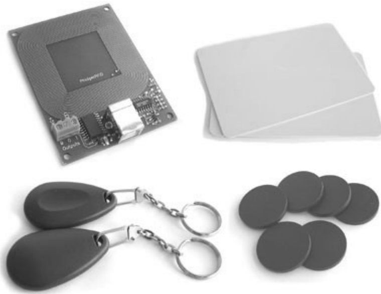
Fig. 1. Tag de identificação por rádio frequência

na fig 1. Ele contém chips de silício e minúsculas antenas que lhe permitem responder aos sinais de rádio enviados por uma base transmissora que ficaria armazenada nos terminais TANIA. [2] [3]